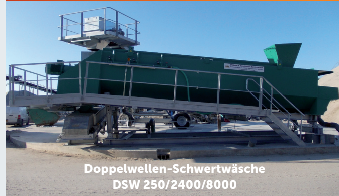
Doppelwellen-Schwertwäsche DSW 250/2400/8000

SCHWERTWÄSCHEN mit spezieller Luftaufströmeinrichtung